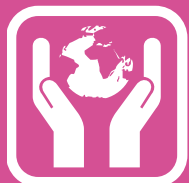
ZAŠTITA ŽIVOTNE SREDINE