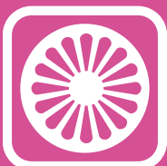
PROMOCIJA ROMSKE KULTURE