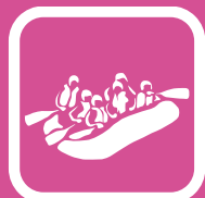
RAFTING / ADRENALINSKI URIZAM