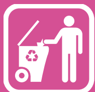
PRIMARNA SELEKCIJA OTPADA